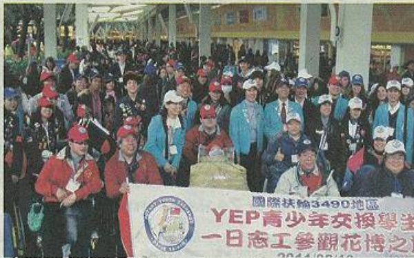
Exchange students from the Youth Exchange Program (YEP) yesterday pose for pictures with 34 physically challenged friends from the New Taipei City Association of Spinal Core Injury at the venue of the Taipei International Flora Expo.

to 300 students from Taiwan every year will attend the program which sponsors them to study overseas.