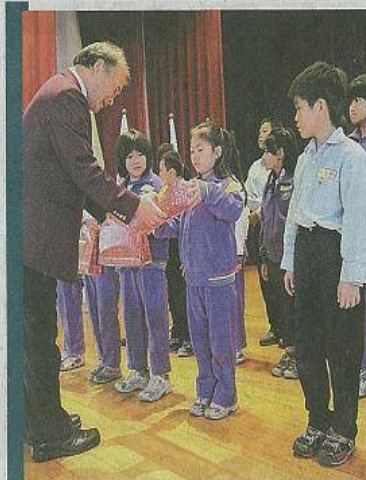
土城、土城中央、土城山櫻和三峽扶輪社昨天協助土城、三峽地區五所小學、兩百名弱勢學童在耶誕節前夕「圓夢」。