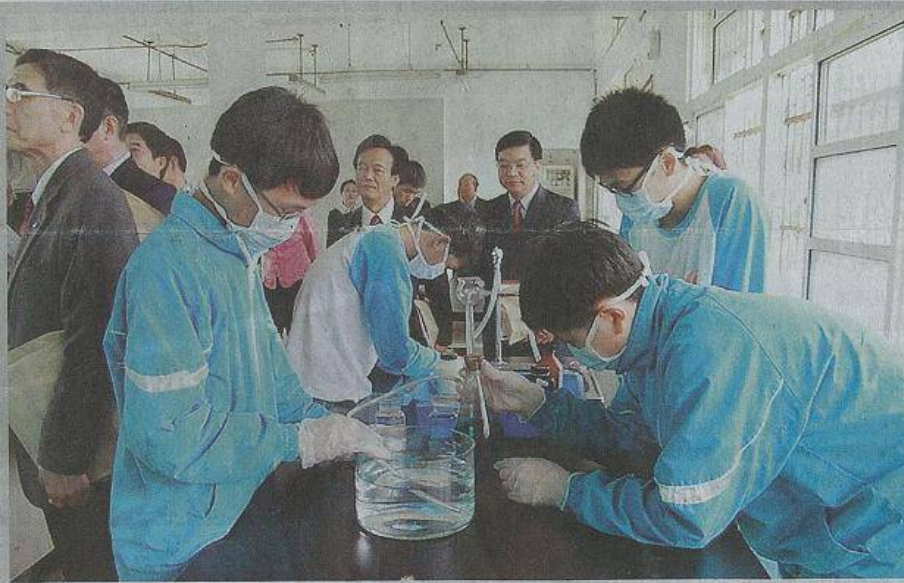
萬里國中昨天啓用理化實驗室新設備，學生使用新設備進行收集氧氣實驗。