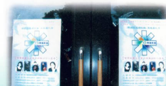
▲與二四七分區共同舉辦「帶頭前進扶輪-飛越莫札特」音樂會製作宣傳手冊並招待弱勢團體前往聆聽