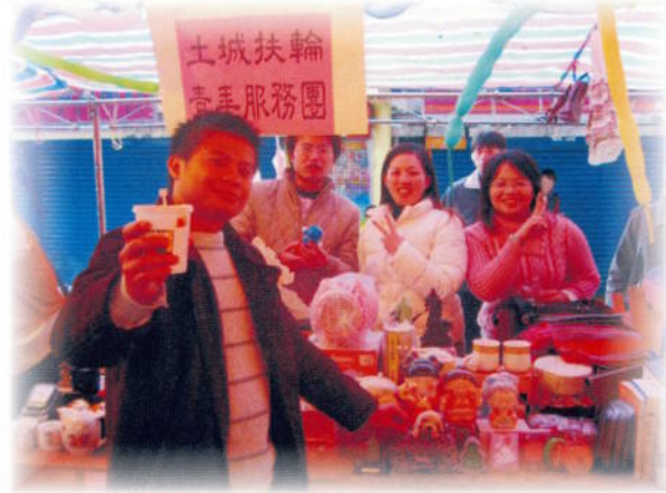
▲ 社區服務－義賣活動