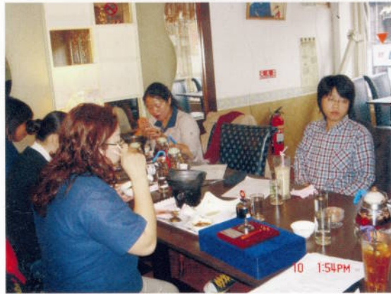
▲ 職業服務－參觀陽明海洋文化藝術館聽取解說