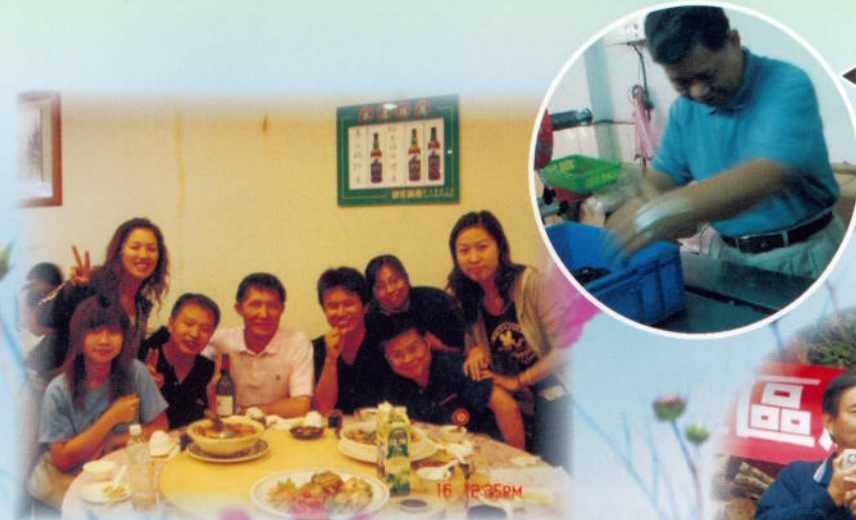
▲ 社區服務－淨山活動餐敘