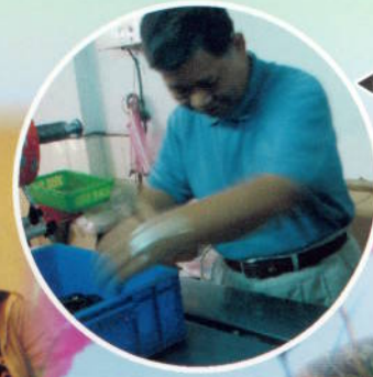
▲ 職業服務－參觀愛加食品公司