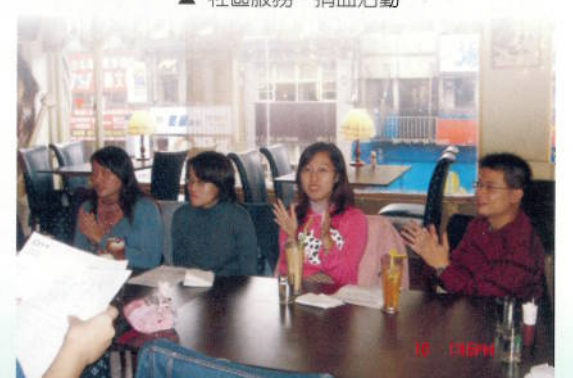
▲ 職業服務－參觀愛加食品公司聽取解說