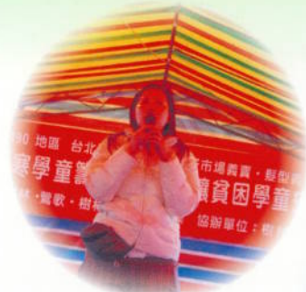
▲ 社區服務－義賣活動