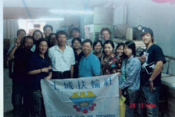
▲ 職業服務－參觀陽明海洋文化藝術館