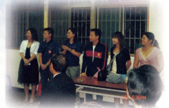
▲ 社區服務－捐血活動