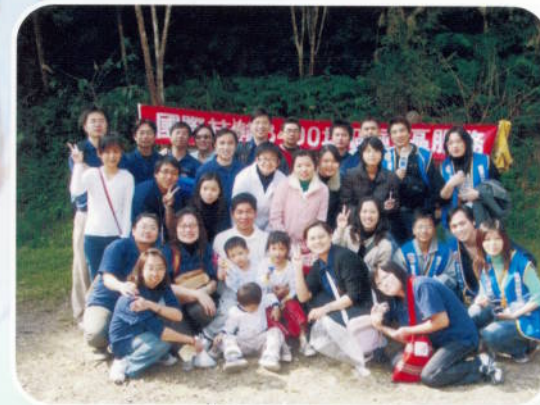
▲ 社區服務－淨山活動