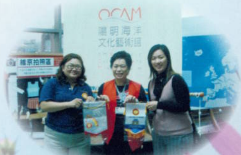
▲ 職業服務－交換紀念旗