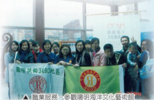
▲ 職業服務－參觀陽明海洋文化藝術館