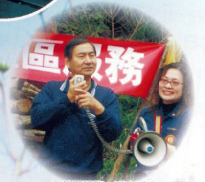
▲ 社區服務－淨山活動