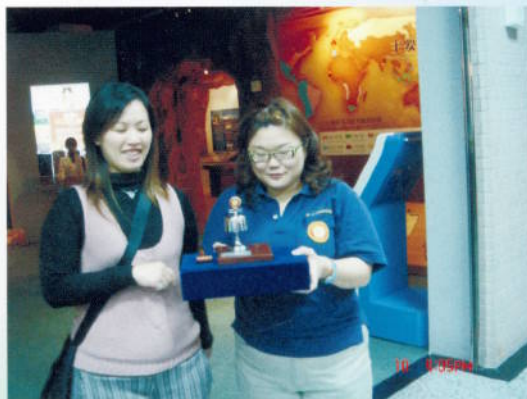
▲ 職業服務－致贈禮物