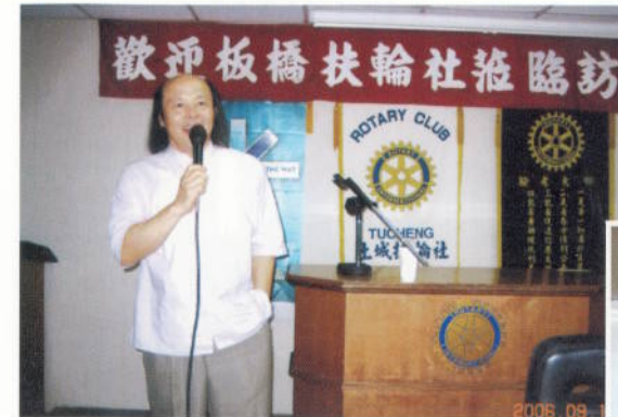
▲名演說家-林清玄先生 日期：2006.09.13 講題：老先覺的話