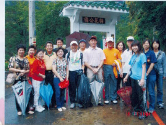
▲ 社區服務－淨山活動