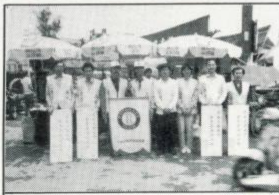
贊助「讓祖先與我們共享潔淨大地」之活動 1987.4.5