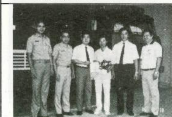
致贈防毒面具予土城消防分隊 1985. 6. 18