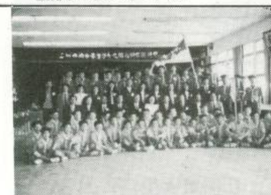
土城扶輪青年服務團社區童軍團成立典禮 1985. 3. 10