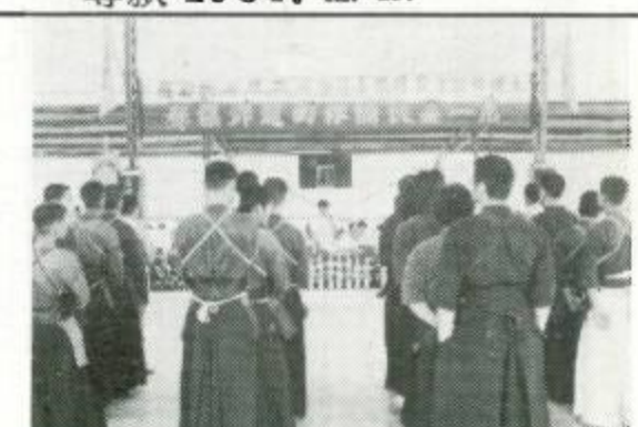
第一屆「扶輪杯」劍道錦標賽盛況 1985. 6. 23