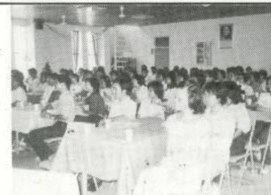
土城鄉大專青年座談會之盛況 1984. 9. 23